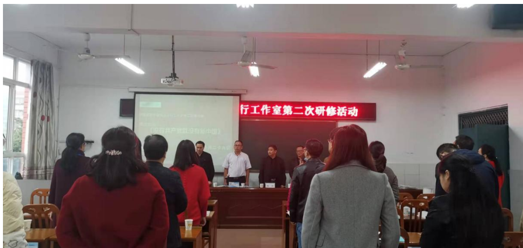
全体参会人员齐歌红歌《没有共产党就没有新中国》

8时40分，在雄壮的国歌声中，活动开始，全体参会人员齐歌红歌《没有共产党就没有新中国》。