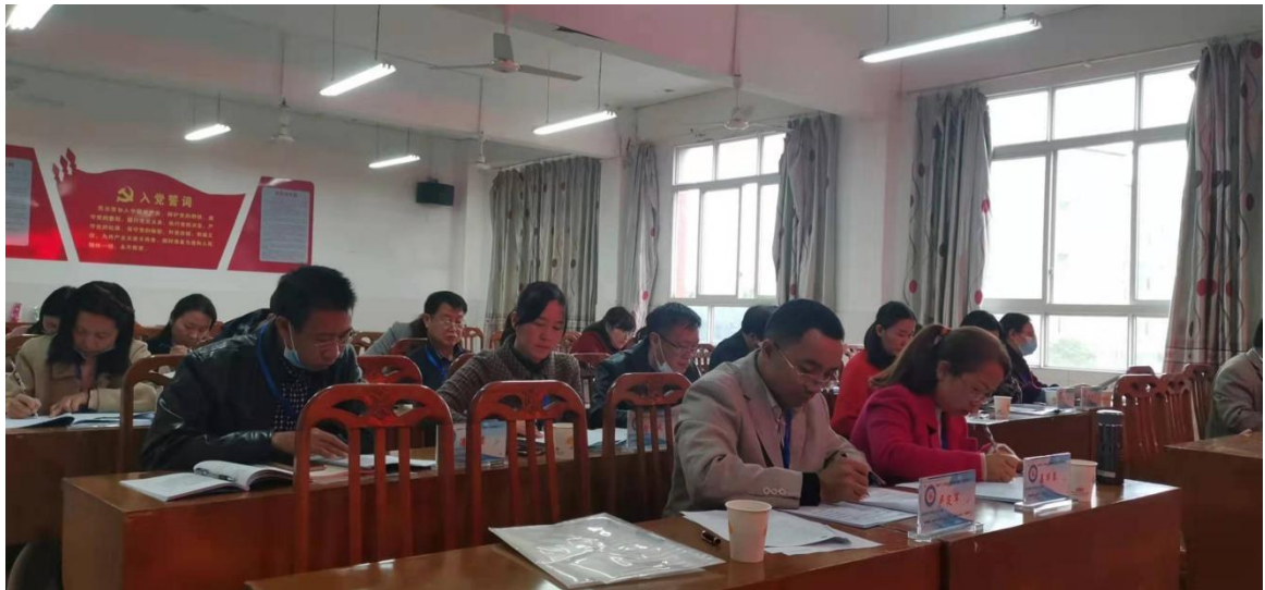
工作室成员认真听取开题报告，认真做笔记