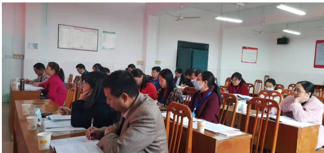
工作室全体成员认真听取了开题报告

的目标、内容、方法等做了详细阐述。工作室全体成员认真听取了开题报告，对研究课题有了较为清晰的认识。